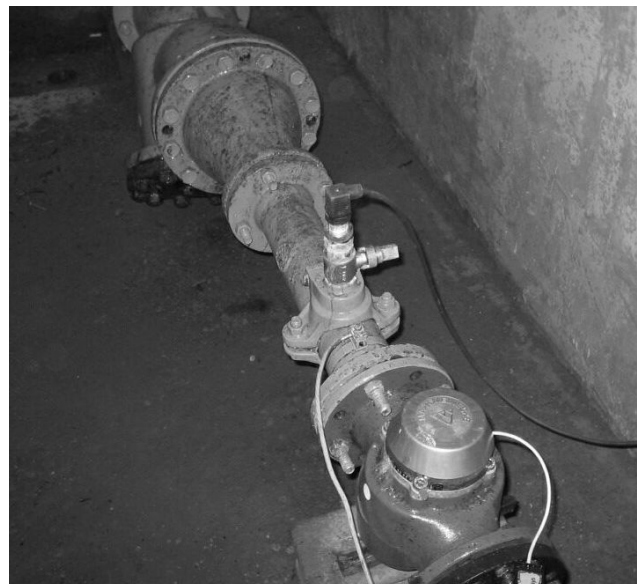
Obr.2. Řídicí místo s měřením

Popisované objekty řízení tlaku jsou ještě vybaveny rozvaděči umístěnými ve zděných pilířích na úrovni terénu.Rozvaděč obsahuje řídicí systém s prostředky dálkového přenosu dat je kabelovým kanálem spojen se šachtou. Sestava je doplněna typizovaným stožárem s anténou, jejíž dostatečná výška nad zemí ji spolehlivě chrání před poškozením.